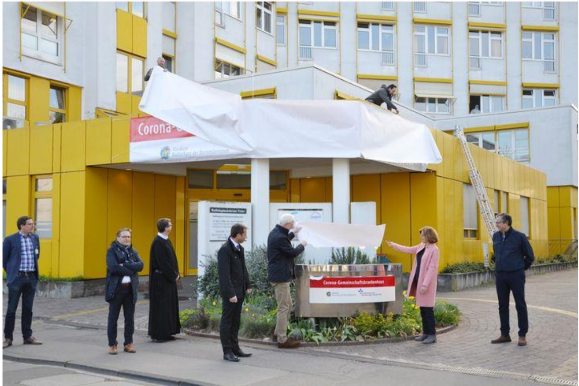
Ministerpräsidentin Malu Dreyer und Oberbürgermeister Wolfram Leibe präsentieren erstmals das neue Logo des Corona-Gemeinschaftskrankenhauses.